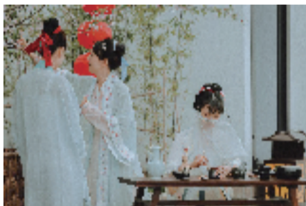
湖州世界乡村旅游小镇·国风主题活动

值得一提的是,新一代毕业生在行程中不再局限于“走马观花”,而是追求更深层次的旅行体验。在出游时长方面,30%的毕业生选择了6天及以上的行程,以便更深入地体验目的地文化和生活。同时,年轻、张扬、有活力的00后更崇尚个性化的行程,美食探店、泡吧、玩桌游、录短视频、旅拍等为旅途平添了更多乐趣。