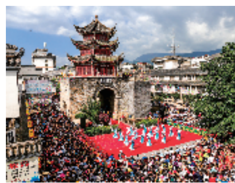
▲国泰民安

“中国天然氧吧”、全国最适宜人居住的美丽小城市之一,“自然(养生)旅游目的地”“四川省十大最具潜力森林康养目的地”“四