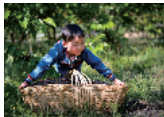
▲德昌县角半村桑椹樱桃节

耕文化、凤凰文化、仓颉文化、“九宫十八庙”佛道教文化、红军红色文化、多彩傈僳族文化如春草般在这片土地茂盛生长。镌刻古邛人文化的全国重点文物战国至西汉大石墓群被誉为“中国金字塔”,省级保护文物魁星阁、字库塔群文风绵延,凉山州唯一的傈僳族文化独具魅力,23项处国家、省、州、县级文物保护单位和27项非物质文化遗产保护名录全面展示德昌历史文化底蕴。“四川省花卉(果类)生态旅游节”“傈僳风情冲浪节”“草坝场农耕文化节”“千年端午药市暨药膳美食节”“角半沟刨汤美食文化节”“傈僳族阔时节”“四川省(冬季)乡村文化旅游节”等特色节庆助推德昌文旅产业高质量发展。