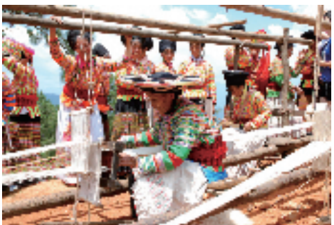
▲火草麻布编织技艺展示

德昌是一带一路缅甸皎漂港线上的重要节点,地处成都、重庆、昆明经济三角区的中心区域,西昌半小时经济圈、攀枝花1小时经济圈、成都昆明3小时经济圈内,北距西昌青山机场40分钟车程,南离攀枝花机场80分钟车程。成昆铁路、京昆高速、108国道、成昆铁路复线纵贯南北,新规划的德会、宜攀等高速网络将打通东西门户,发展潜力巨大,高铁、高速、航空等交通网络纵横贯通。