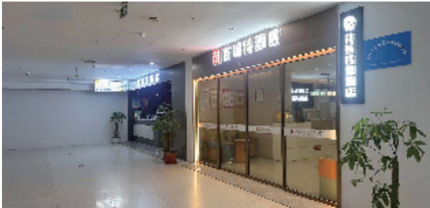
▲两家酒店并排陈列

走进西湖边的涌金广场，一楼电梯厅楼层导览牌上，从三楼到六楼，密集排列着9家不同酒店名字。乘电梯上行，三楼是“吉瑞特酒店”“杭新景酒店”等多家单体酒店的聚集地。再往上，四楼电梯门一开，眼前便是如家·neo的接待区，它承包了整个楼层。继续升至五楼，则是“五星湾酒店”的领地，同层还隔出了一家“安泊青年旅社”……而五星湾酒店、亚辰酒店和如家酒店三家酒店都把前台放到了一楼大厅。