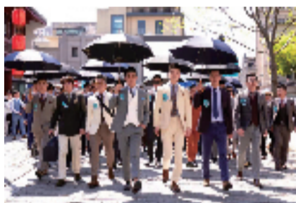
▲乔顿服饰首届时装周

游消费试点城市建设,促进传统工业转型升级和提质增效,加快模式创新、业态创新、机制创新,以“观光工厂”建设等为载体,到2024年,推出一批工业旅游示范点,设计一批工业旅游产品,打造20条以上工业旅游精品线路,新培育18个以上国家、省级工业旅游示范基地(点),将温州打造成国内知名的工业旅游示范城市。