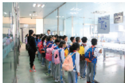
▲研学游走进百强乳业

观光场景,打响工业旅游特色品牌。树立“温州模式探秘”“研学”“工业遗产”“创新工厂”等温州工业旅游特色主题。鼓励外地游客探秘温州民营企业发展史,打造工业+研学旅游线路,让游客读懂传奇温州,让学生了解工业演变。