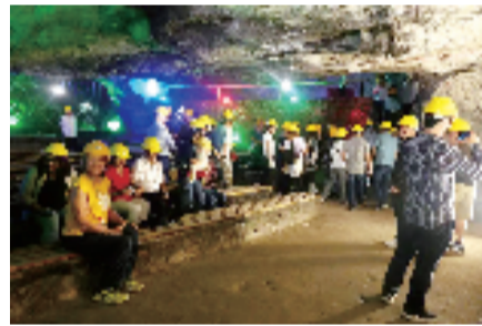
▲外籍游客考察体验温州“世界矾都”遗址

景区场景,明晰工业旅游功能区域。温州鼓励具备条件的工业企业按照3A级以上景区标准进行“微改造精提升”,合理规划观光区、体验区、展览区、购物区、游憩区等功能区域,满足游客参观、食宿、购物和休闲娱乐需求。