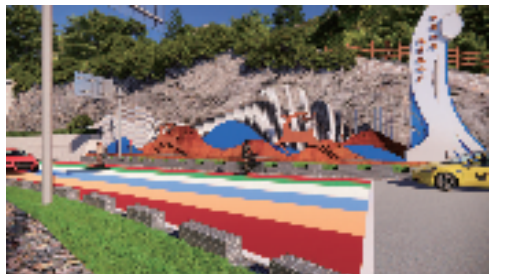
▲改造后的隧道(右入口)