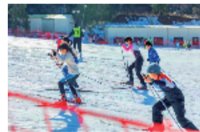
▲雪窦山商量岗景区

五是政策激励释放文旅消费活力。各地把元旦春节期间作为促消费、稳增长的重要机遇期,强化政策集成,文旅消费活力全面释放。元旦假日期间,来浙游客人均花费1071元,同比增长4.9%。文旅消费券影响力持续扩大,与携程、美团等OTA平台合作,应用大数据对客源地进行精准推介,通过消费满减、活动营销、媒体宣传,助力行业发展。嘉兴的濮院时尚购物节2天接待游客7万人次,实现总营收6000多万元。