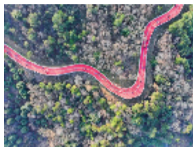
▲不少游客在舟山选择登高迎新

一是旅游市场复苏强劲。假日旅游市场复苏势头强劲,旅游接待游客人次、旅游收入总量等主要指标均创历史新高。日均接待游客量达到682.6万人次,同比增长67.3%;全省纳入监测的252家4A级及以上景区接待游客同比增长21.5%。