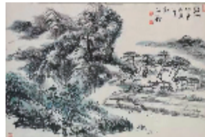
▲ 齐开义《徽州印象》68cm x 50cm

著名美术评论家郎绍君先生评价齐开义的草书作品,笔力雄健,有酣畅淋漓之妙。见字如见人,齐开义为人也当如是吧。