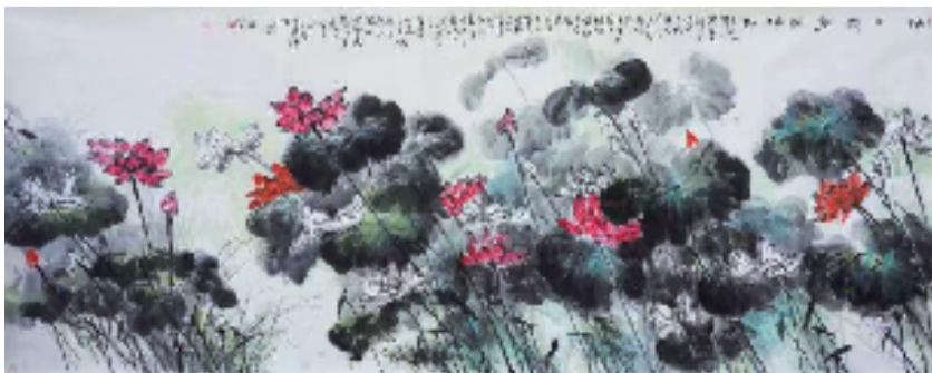
▲ 齐开义《映日荷花别样红》137cm x 68cm

这场聊天,天南地北。就像齐开义在博物馆的几十年生涯,广博且厚重,就慢慢的沉淀于生命里,呈现出生命丰富的色彩。作品是齐开义的一面镜子,他看着这面镜子,自省内心,外观世界,最终将其凝固为生命的一张张剪影。写什么,画什么,变得不那么重要,重要的是生命与这个世界最终在笔下呈现出了现实掩盖之下的万象。