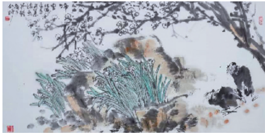
▲ 齐开义《冷香》137cm x 68cm