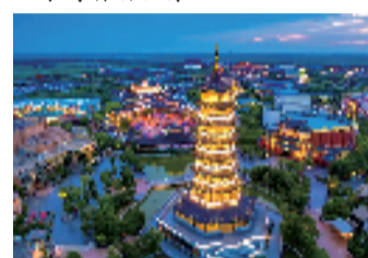
▲宁波方特东方神画

关负责人表示,以适应新需求、探索新路径、培育新动能、塑造新优势为牵引,坚持增量拓展、存量提升、打造爆款工作思路,高标准推进旅游景区转型提质发展,构建省内一流、国内盛名、享誉世界的全域大景区体系。