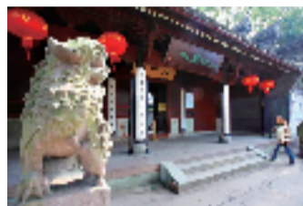
▲宁波市天一阁·月湖景区

同时,行动计划还提出,鼓励景区发展“宁波味道”特色餐饮,鼓励景区推出季节性、主题