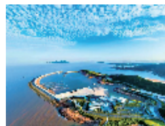
▲松兰山滨海旅游度假区