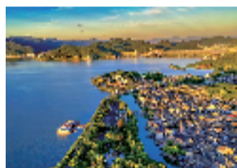
▲东钱湖国家级旅游度假区

性餐饮消费季活动。推动景区研发特色文创产品,培育一批景区文化雅集、旅游集市、文博市集等。