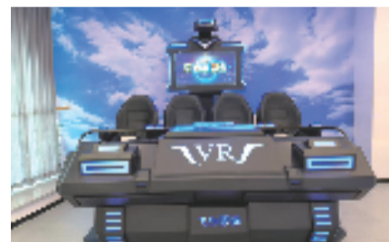
▲少儿馆中VR飞行影院

近年来,宁波持续推进城乡公共文化服务标准化、均等化建设,为全市人民创造良好阅读环境和便利条件,用丰富多彩的全民阅读活动点亮城市的每一个