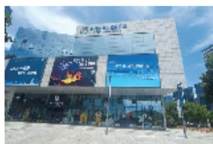
▲宁波少年儿童图书馆

对儿童友好,就是对城市的未来友好!1月4日,记者从宁波市文化广电旅游局获悉,宁波10个区(县、市)少儿图书馆于2024年底全部建成,2025年元旦前后陆续开馆。宁波由此成为全国首个实现市、县两级少儿图书馆全覆盖的城市。