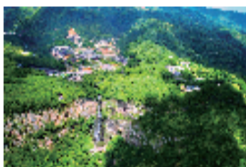
▲奉化溪口·滕头景区

级旅游度假区等国家级品牌目的地建设富有文化底蕴的世界级旅游景区、度假区;推动高等级旅游景区、省级旅游度假区品质提升,打造10家以上具有示范引领作用的标杆型特色景区;推动新业态景区培育建设,打造50家以上以特色主题景观为核心的“微度假”精品景区。