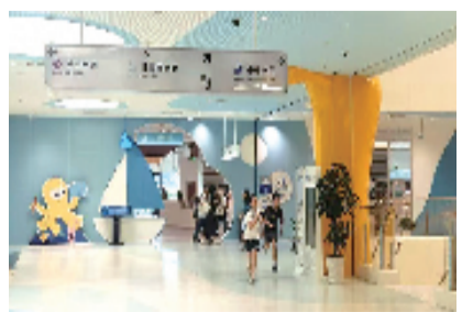
▲宁波少年儿童图书馆一角

据介绍,2024年7月,宁波少年儿童图书馆正式启用,以“儿童友好”“分级阅读”为服务方向,以“平等友好 智慧多元”为服务理念,为广大读者特别是不同年龄段的少年儿童提供文献借阅、参考咨询、阅读指导、阅读推广活动等服务,开馆至今,已接待读者约50万人次,举办活动267场,吸引近80万人次参与。