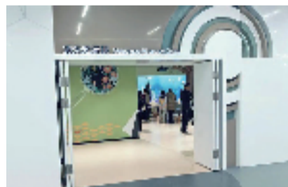
▲北仑少儿图书馆观光探索屋

宁波市文化广电旅游局相关负责人表示,场馆建设过程中,宁波各区(县、市)少儿图书馆充分结合当地特色和区域实际,考虑少年儿童特点和需求,设置分级分龄阅读体系,在阅读空间打造、少儿读本配置等方面也结合当地历史文化,体现浓郁地方特色。如北仑馆结合贺友直、周大风等当地文化名人,打造友直艺术廊、大风剧场等空间。